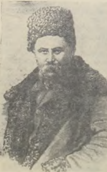
Судьба поэта необычайно трагична. Всего 47 лет про-

инский поэт стал славой и гордостью народов нашей страны.