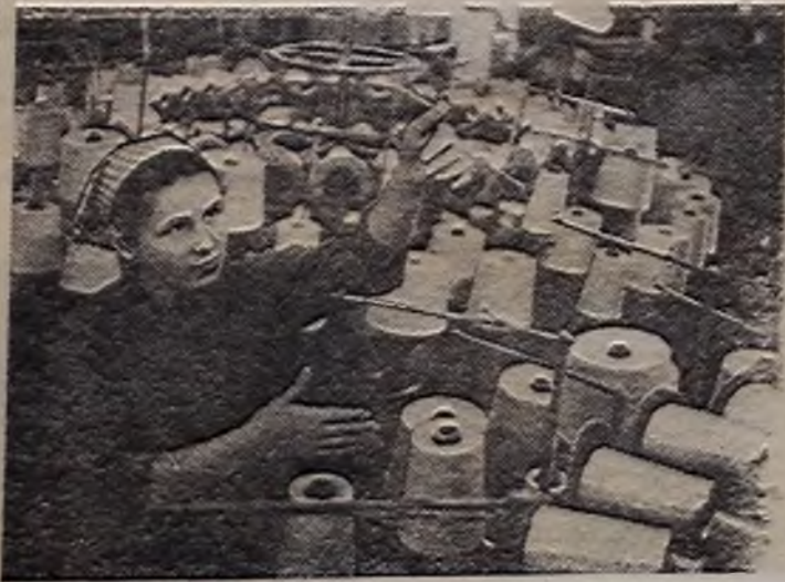
РИГА. «Советское — значит отличное» — под таким девизом работает фабрика «Балтия». В нынешнем году предприятие не получило ни одной претензии к качеству продукции. Производительность труда возросла на 8,7 процента по сравнению с про-

шлым годом. Фабрике присвоено звание предприятия отличного качества.