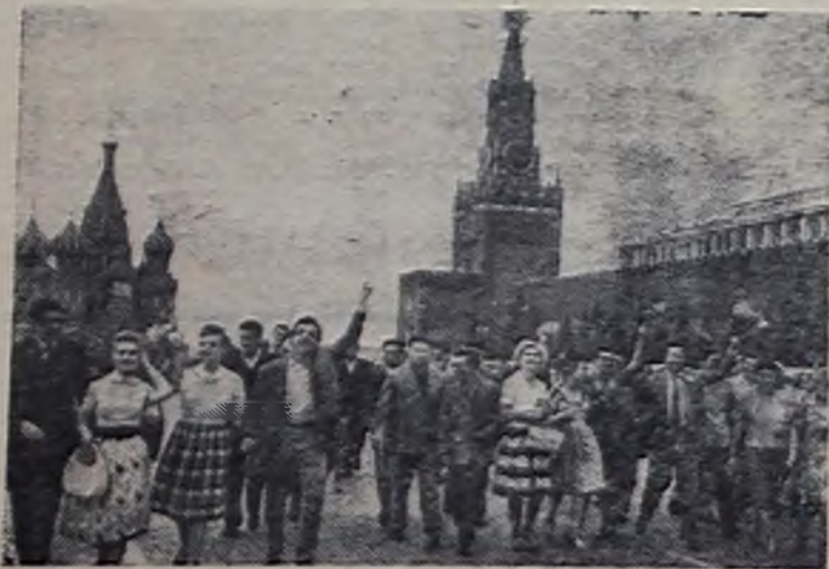
Группа молодежи из стран Латинской Америки с москвичами на Красной площади.