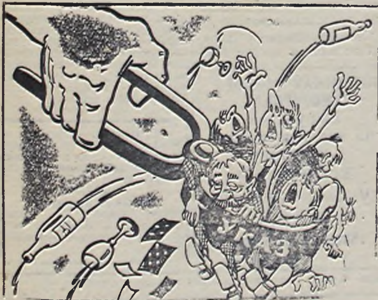
Рис. Д. Белова.

На участке Тогачево не было кинобудки, поэтому не демонстрировались кинофильмы. В настоящее время кинобудка готова, и фильмы будут демонстрироваться регулярно».