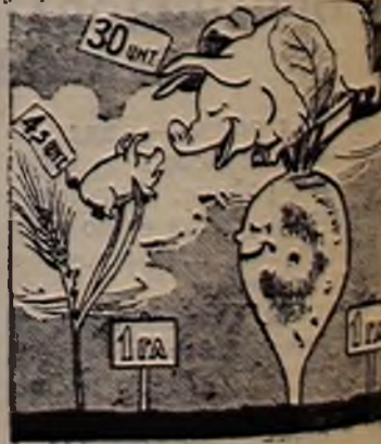
Рис. В. Персова.

Во всех бригадах свекла растет. Но особенно она хороша на полях четвертого производственного участка, где ее посажено 3,5 гектара. Колхозники любовно ухаживают за ней, помня, что при откорме сахарной свеклой животные дают более высокие суточные привесы.