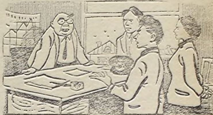
— Вы обещали построить общежитие, столовую, клуб, магазин. А разве этих обещаний мало? Рис. А. Цветкова.