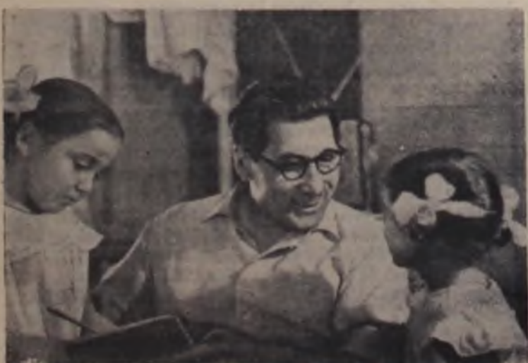
АШХАБАД. Дангатар Овезов — один из любимых композиторов туркменского народа. Много лет на сцене Туркменского театра оперы и балета ставятся его оперы «Шасенем и Гариб», «Лейли и Меджнун», Симфонический оркестр филармонии свои праздничные

концерты начинает с его оперы «Ленин». А песни Овезова «Бей, барабан», «Имею дворец» и другие знает каждый туркменский пионер.