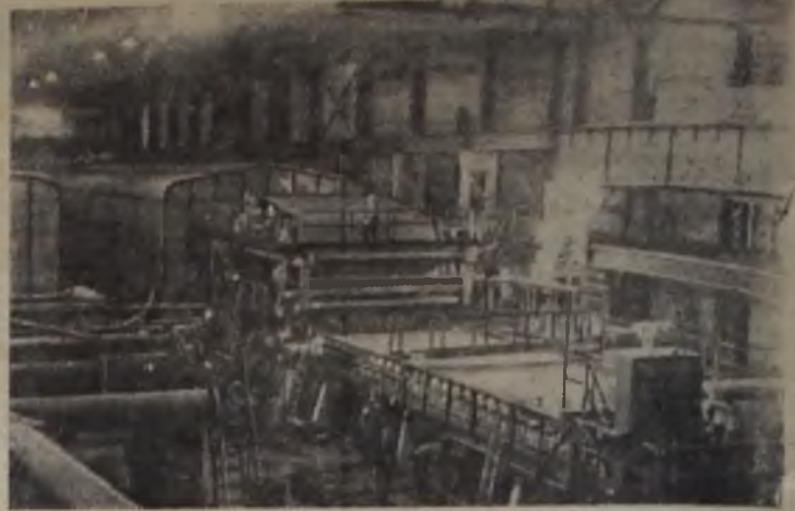
КАРЕЛЬСКАЯ АССР На Кондопожском целлюлозно-бумажном комбинате начала действовать пятая бумагоделательная машина, самая мощная на комбинате. Ее производительность 52 тысячи тонн газетной бумаги в год. За одну минуту она может дать более шестисот метров бумажной ленты шириной почти в пять метров. Управление машины автоматизировано.

Для получения книг почтой заказы направлять по адресу: Москва, Центр, Б. Черкасский пер., 2-10, отдел «Книга-почтой» конторы «Академкнига».