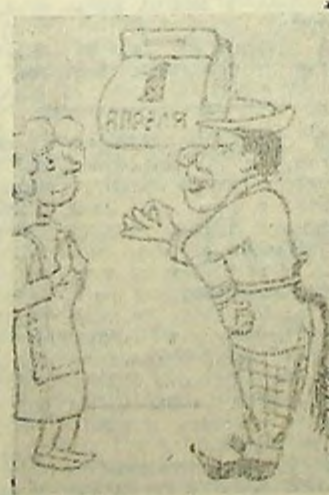
— Ну и здорово же я разырел модия скардаков! Рис. С. Самодурова.

Если незаменимых людей нет, то кого же заменяют? Лучше уйти по-хорошему, чем по собственному желанию. Студенты только за счет того и живут, что не едят. Обычно больше всех теряет тот, кому терять нечего. Если хочется, но нельзя, значит, очень хочется. Какими беспомощными стали женщины, почувствовав свою силу! Сколько уверенности придает человеку мысль: «Была не была!» Белых пятен на земле все меньше, а черных? Чем хуже у человека становится память, тем чаще он вспоминает о своих заслугах. Пока с женщиной не поругаешься — она тебя не простит. Загрузишь в магазине сумки и сразу становится как-то легче. Дураков — обманывают, умных — вводят в заблуждение. А. ПЕРЛЮК.