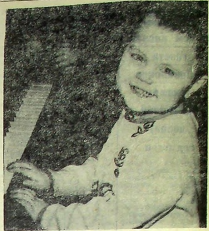
«Пусть всегда буду я!».

Начинается урок. Валентин достал сырок. Витка — толстый бутерброд С колбасой и сыром. Сладко чавкая, жуёт Шоколадку Ира. Вдруг запел учитель пенья: — Кончилось мое терпенье! До-ре-ми-фа-оль-ля-си! Закрываю пианино — Открываю буженину. Да фасоль, да иваси!