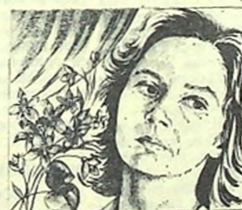
одинокая женщина желает познакомиться...

Сюжет фильма «Вам что, на- ша власть не нравится?» (Мос-