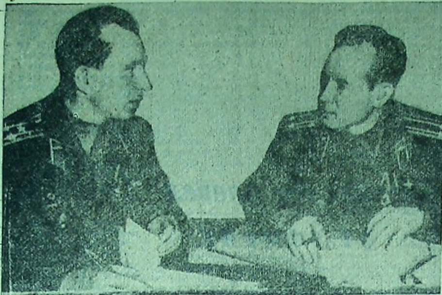
НА СНИМКЕ: командир корабля «Восход 2», наш земляк П. И. Беллев и А. А. Леонов после полета.

18 МАРТА — 25-ЛЕТИЕ ПОЛЕТА КОСМИЧЕСКОГО КОРАБЛЯ «ВОСХОД 2»