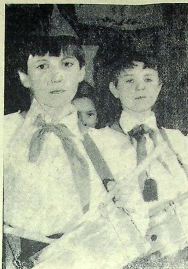
НА СНИМКЕ: юные барабанщики средней школы № 2.