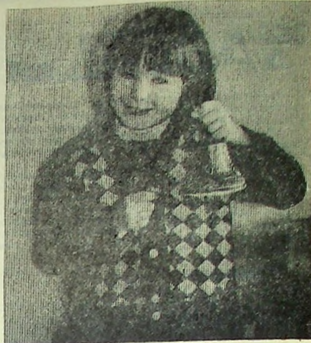
Первый звонок...

ОТ РЕДАКЦИИ: Наверное было бы неплохо, если бы горисполком или службы, отвечающие за эксплуатацию надежных сетей, разъяснили читателям: куда можно обратиться, если создалась аварийная ситуация в квартире в связи с повреждением электропроводки, канализации, водопровода в вечернее, праздничное время или в выходной день?