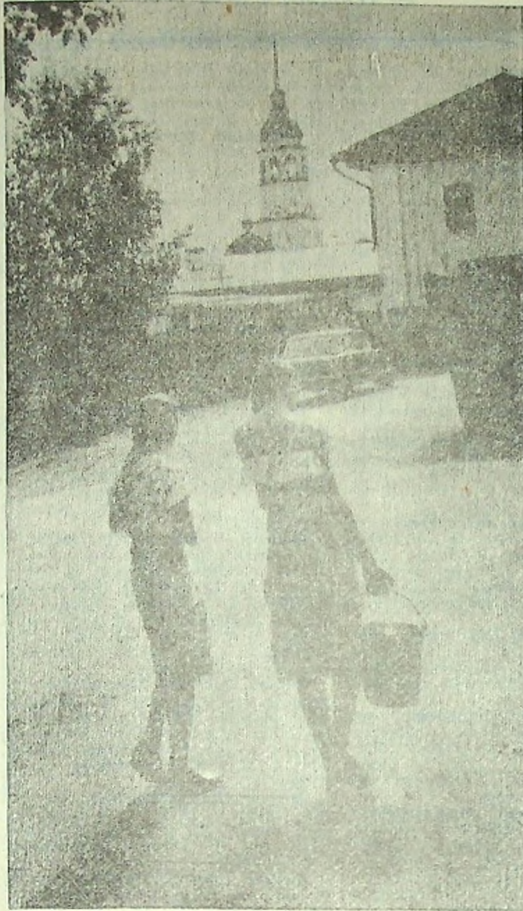
Шла девица за водой.