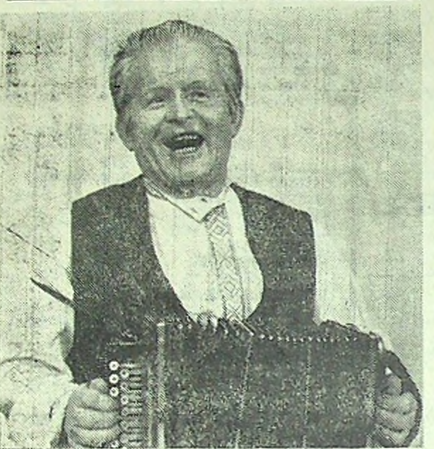
МОСКВА. В Колонном зале Дома союзов, в рамках 6-го съезда композиторов РСФСР, был дан большой концерт.