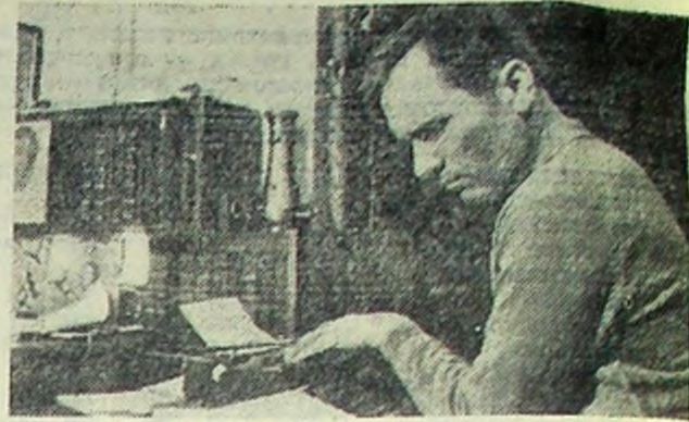
НА СНИМКЕ: В. М. Шукшин.

СЕГОДНЯ — 60 ЛЕТ СО ДНЯ РОЖДЕНИЯ В. М. ШУКШИНА (1929—1974), СОВЕТСКОГО ПИСАТЕЛЯ, КИНОРЕЖИССЕРА, СЦЕНАРИСТА, АКТЕРА