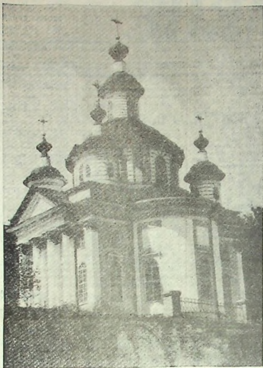
Спaso-Суморин монастырь. Вознесенский собор, XVIII век. С 1978 года ведутся реставрационные работы.