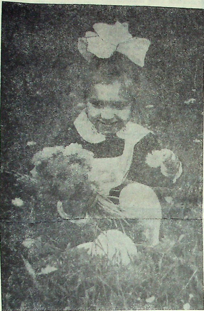
Цветы для первой учительницы.

Вот и промчалось лето, а с ним ушли и школьные каникулы. Снова первое сентября и дети спозаранок спешат в школу. Для кого-то это будет последний год в ее стенах, а кто-то с волнением перешагнет школьный порог впервые.