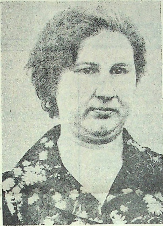
У каждого свой путь в дальних краях, другой ос- таётся дома, там, где родил- ся и вырос.