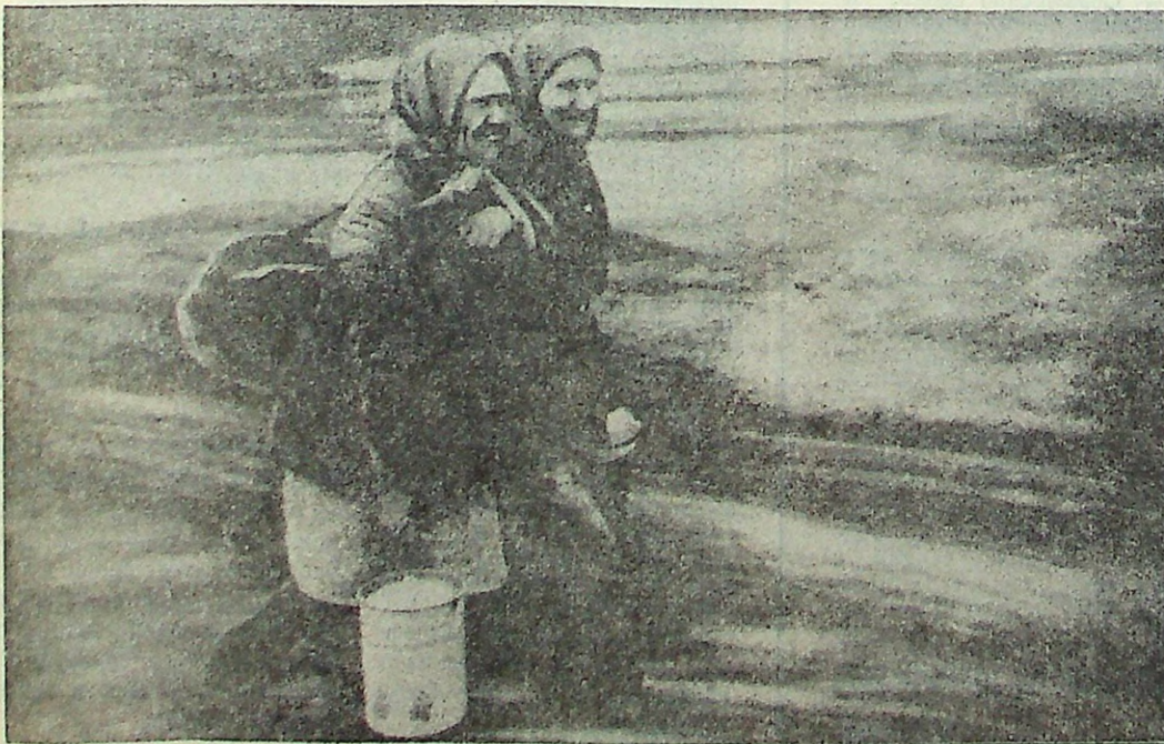
ПЕШКОМ В РЫНОК...