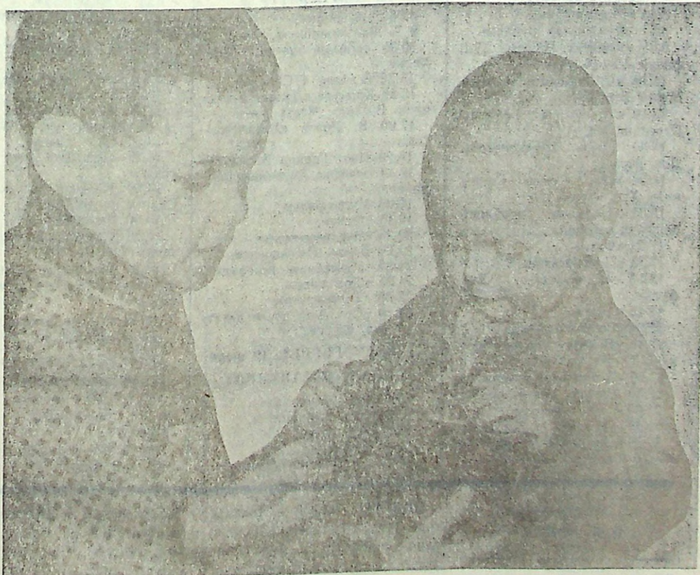
Не Боги горшки обжигают...