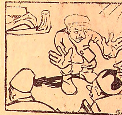
СОКЛЮБ: ИДИТЕ РУБИТЬ, С БАРЖАМИ УСПЕЕТСЯ.