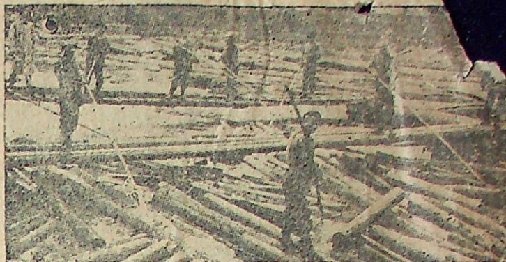
Последний лесоматериал в разборочных воротах на реке Цареве.