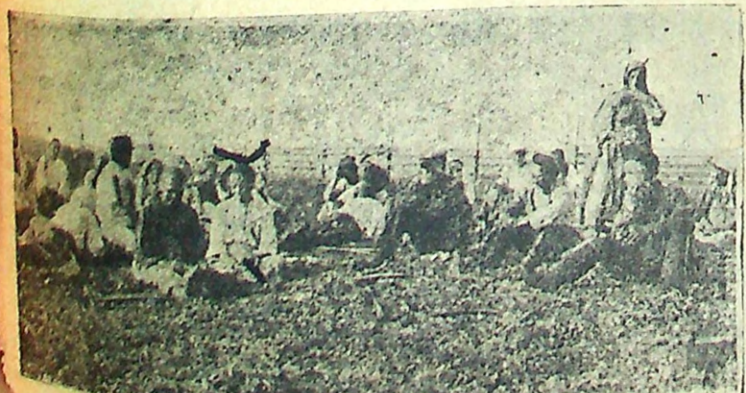
„ЗАЛОГА“ НА СЕНОКОСЕ.

Колхоз „Борьба“ Матвеевского сельсовета.