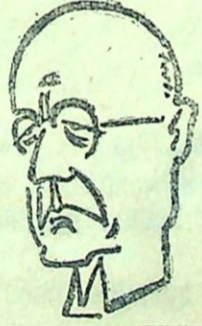
Глава диктаторского правительства БРЮНИНГ

Опубликован чрезвычайный декрет правительства Брюнинга, предусматривающий проведение ряда финансовых мероприятий, направленных против широких масс трудящихся, и в первую очередь против безработных и инвалидов. Коммунистическая партия организует кампанию протеста против этого декрета. Кампания начнется собранием в Спортпаласе 11 июня, на котором выступит тов. Тельман.