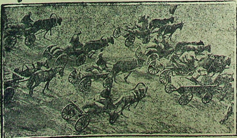
КРАСНЫЕ ОБОЗЫ „1-го АВГУСТА“

ники. Оба прогульщики. По вине Тяпкина до сих пор не получаются простои на фабрике временной подачи сырья. Выдрин-же после объявления себя ударником сделал дело. Позор лжеударникам!