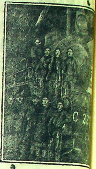
Пуск нового паровоза

Скоро полгода, как мастерские начали ходатайствовать о снабжении их продпайком по 1 категории—наравне с лесозаводом. Но все тщетно. К лесозаводу приравнили даже сапожную мастерскую, где на 50% случайный элемент, а производственные мастерские попреж ему относятся к сельской местности (уж не потому ли, что мастерские находятся за городской чертой?). Рабочие производственных мастерских ждут от правления ГорПО и РИКа разъяснения: чем школа-фабрика хуже сапожной мастерской? Бэн.