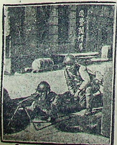
Японские пулеметчики в боевой позиции на улицах Мундена.