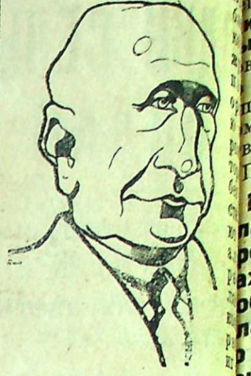
Глава буржуазного правительства Испании Заморра.

Что же изменилось после падения монархии? Вывески—решительные