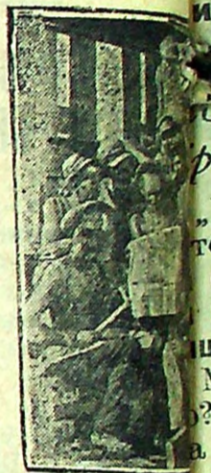
Рабочие Москвойской м. д. за речью тов. С.