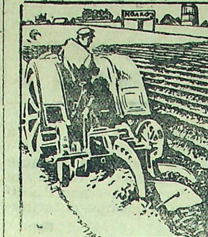
Где оплата сдельная, Там работа дельная.

Крайколхозсоюз отмечает, что колхозы, прочная и действительная опора советской и партийной в деревне—должны итти впереди и быть застрельщиками в выполнении основных хозяйственно-политических заданий, в то же время, несмотря на ряд исторических предупреждений крайколхозсоюза колхозам о выполнении ими взятых обязательств перед государством—особенности по маслозаготовкам, выполнении основных хозяйственно-политических заданий и в частности маслозаготовки колхозы ведут явно неудовлетворительно.