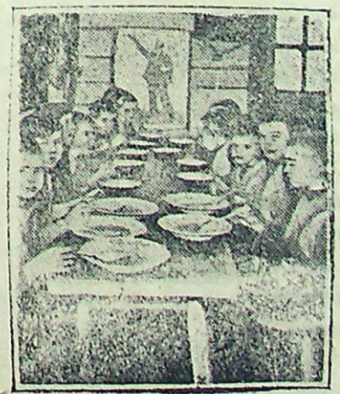
НА СН ИМКЕ: Дети колхозников за обедом в детском садике.

Колхозцентр предложил всем колхозам проработать решения VI всесоюзного съезда Советов не позднее 15 апреля. Особенное внимание при проработке ре- шений VI съезда надо уделить докладу тов. Яковлева. Обсудить: о переводе ос- новных с/х работ на сдельщину, об уче- те в колхозах и т. д.