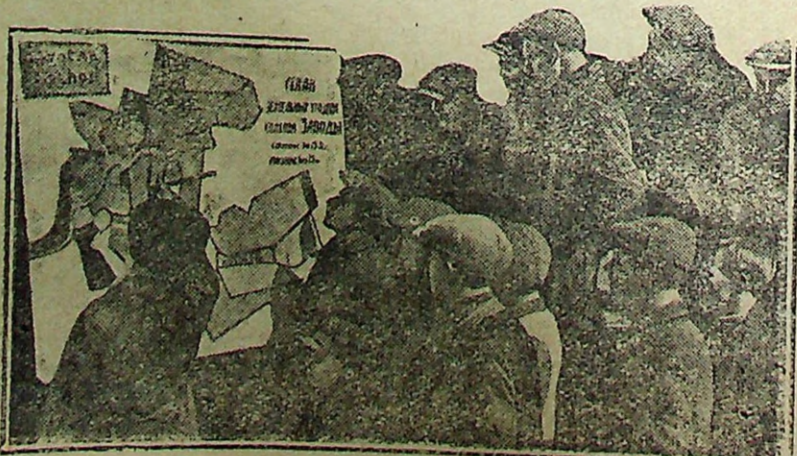
Комсомольцы на занятиях по полит-учебе.

Вновь открытые школы остро нуждаются в инвентаре, и главным образом в учебниках. Например в Шум-на школе из-за недостатка учебников приходится заниматься в