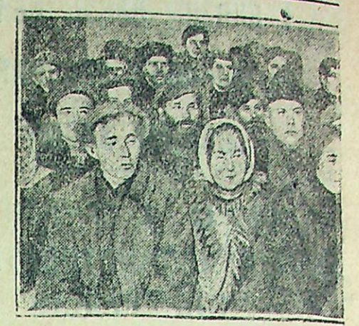
Слушают отчет Горсовета