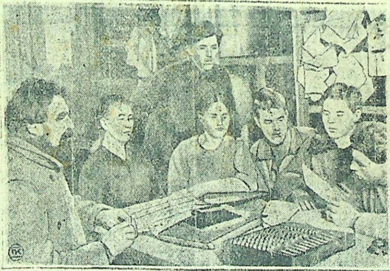
Колхозная бригада за проработкой устава ТССС.