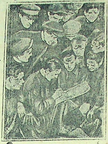
Подписываются на облигации займа „Пятилетка в 4 года“