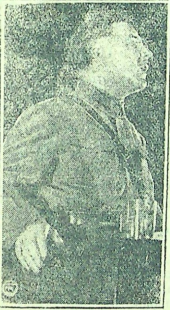
Тов. Ворошилов на трибуне IX съезда ВЛКСМ.

«Хочу, чтобы с этого IX съезда в среде комсомола наступил действительный перелом, и комсомол занялся вопросами обороны по-настоящему, по ленински. Желаю вам, товарищи, найти в себе силы, ленинскую настойчивость, энергию разрешить эти важнейшие вопросы, как в количественном так, и особенно, в качественном отношении. Да здравствует ленинский комсомол! (Бурные аплодисменты всего зала. Все встают. Возгласы: «ура!»).