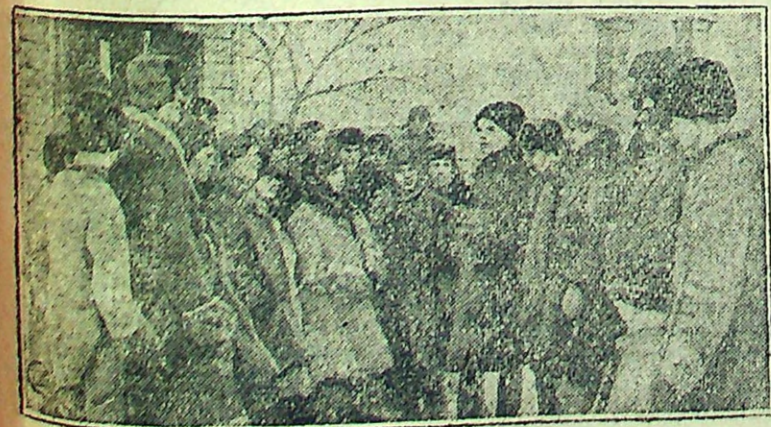
Берлинский комсомол начи- нает вербовоч- ную кампанию. Союз ставит своей задачей удвоение числа членов комсо- мола.

После избрания крайисполкома и деле- гатов на Всероссийский с'езд, секретарь Севкрайкома ВКП(б) тов. Иоффе об- ратился к с'езду с речью, посвященной положению на лесозаготовках.