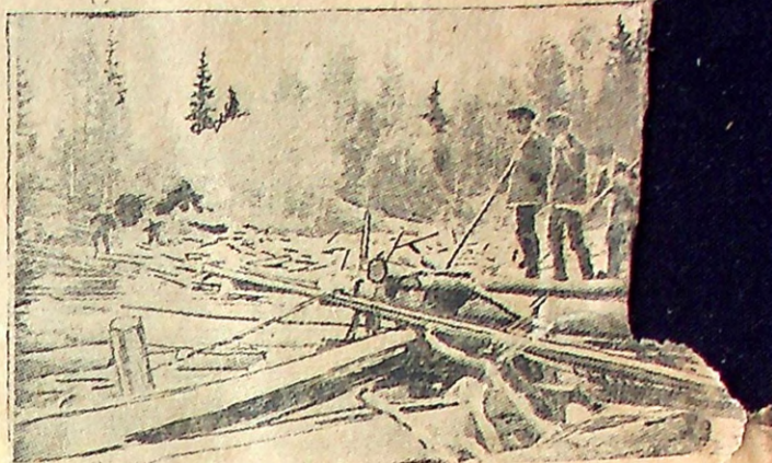
Разборка лесоматериала у запянных ворот.

Подписка принимается Тотемск. почт.-тел. отделением, агентствами и всеми письмомосцами.