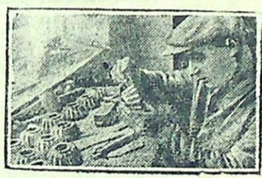
Ударник за проверкой тракторных шестеренок