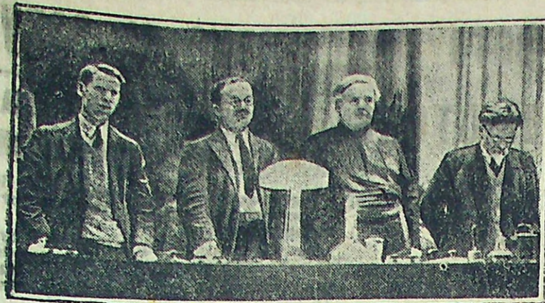
ОТКРЫТИЕ XV ВСЕРОССИЙСКОГО С'ЕЗДА СОВЕТОВ.