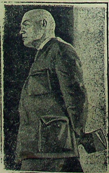
Тов. Крыленко допрашивает подсудимых.