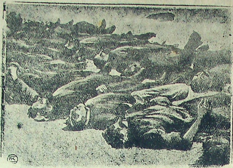
Что готовили нам меньшевики-интервенты.