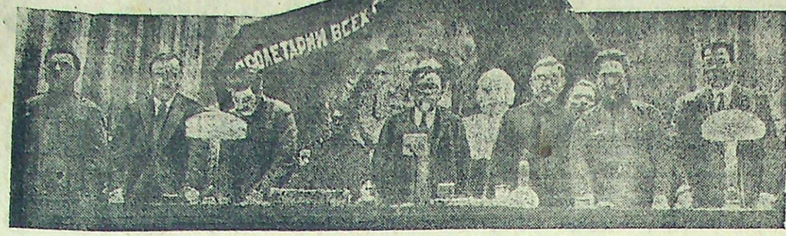
На снимке: Слева направо т.т. ВОРОШИЛОВ, МОЛОТОВ, СТАЛИН в центре тов. КАЛИНИН, справа от него т.т. ПЕТРОВСКИЙ, ОРДЖОНИКИДЗЕ и РУДЗУТАК.