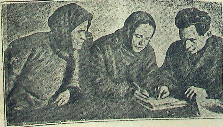
Колхозницы колхоза „Путь к социализму“, Брянский район, начали кампанию по сбору средств на постройку МТС.