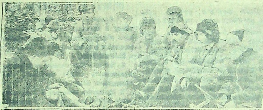
Одна из бригад Матвеевского лесопункта во время „залог“ читают газету „Рабочий Лес“.

Рабочим темпам, кулацкой агитации, оппортунистическим настроениям — должен же быть положен конец. Каждая партийка, каждый сельсовет, лесопункт и отдельный руководитель лесопункта должны обеспечить темпы работы не ниже 1 1/2 — 2 проц. ежедневного выполнения лесозаготовительной программы и добиться средней нормы вырубке 3,5—4 кубометров в день на каждого лесоруба.