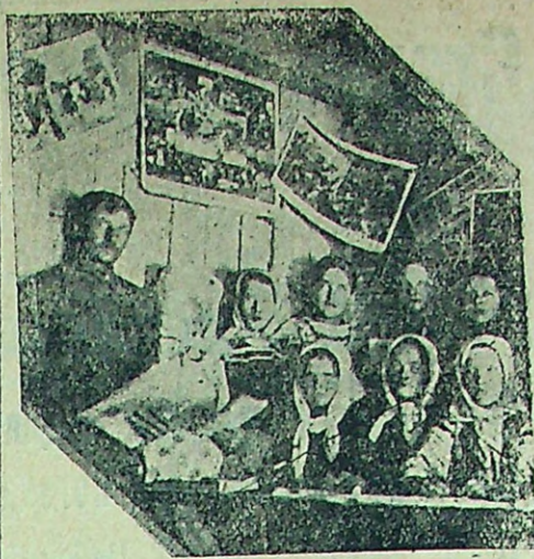
Занятия на ликпункте в лесном бараке

Мы ни на минуту не сомневаемся в том, что после долгих блужданий Тотемской организации Осоавиахим в оппортунистических тенетах, районная конференция выведет ее на дорогу широкой общественно-массовой деятельности.