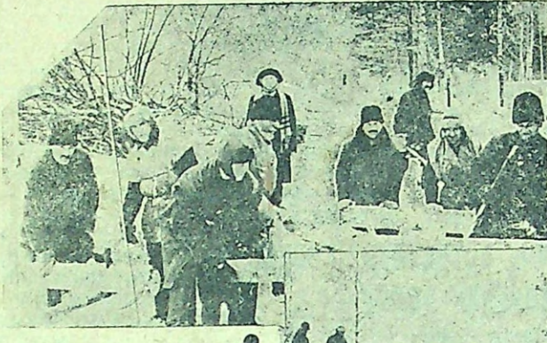
В трехдневник оборонли работали в лесу профсоюзные бригады. На снимке: отдельные моменты бригадной работы.

В сельсовет, в лесопункт, в лес — на проведение ударного месячника лесозаготовок